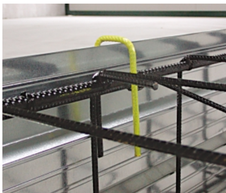
Particolare della greccatura che funge da copriferro.

Prima di gettare il plinto si inseriscono altri pannelli FlashFond® per creare l'esterno del bicchiere. Sarà sufficiente annegare i primi 5 cm di