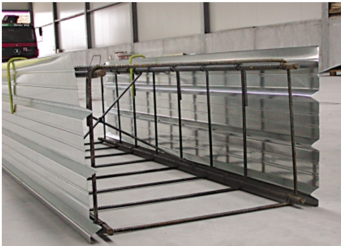
Particolare della greccatura.