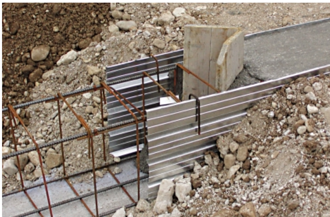
Particolare della realizzazione di un bicchiere.